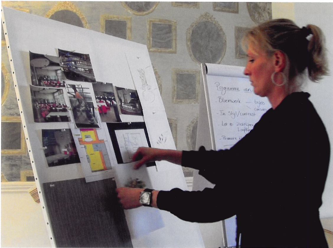
Afb. 2 Als voorbereiding op het maken van een presentatie in de winkel of de etalage maak je een moodboard. Bedenk een thema, zoek passende sfeerplaatjes en kleuren.